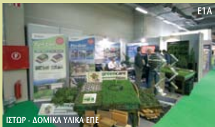
ΙΣΤΟΡ - ΔΟΜΙΚΑ ΥΛΙΚΑ ΕΠΕ