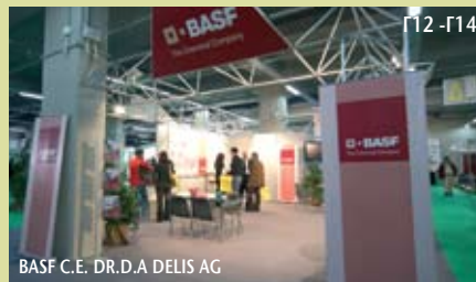
BASF C.E. DR.D.A DELIS AG