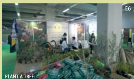
E6 PLANT A TREE