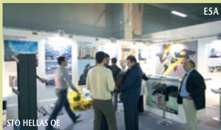
STO HELLAS OE