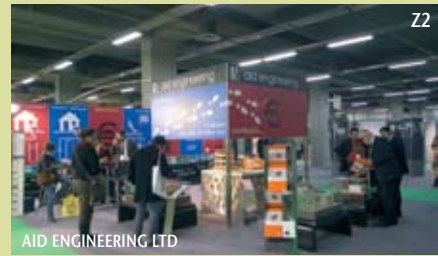
AID ENGINEERING LTD