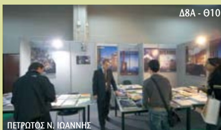
Δ8Α - Θ10 ΠΕΤΡΩΤΟΣ Ν. ΙΩΑΝΝΗΣ