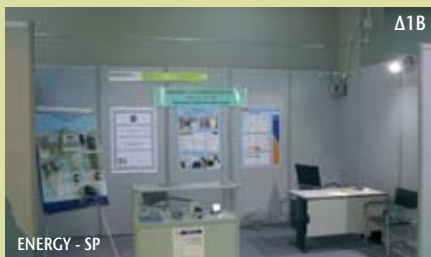
ENERGY - SP