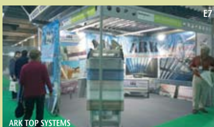
E7 ARK TOP SYSTEMS