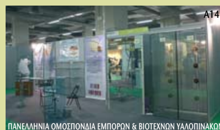
ΠΑΝΕΛΛΗΝΙΑ ΟΜΟΣΠΟΝΔΙΑ ΕΜΠΟΡΩΝ & ΒΙΟΤΕΧΝΩΝ ΥΑΛΟΠΙΝΑΚΩΝ