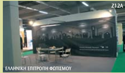
ΕΛΛΗΝΙΚΗ ΕΠΙΤΡΟΠΗ ΦΩΤΙΣΜΟΥ

κτιρίων, οι οποίες χαρακτηρίζονταν από φυτεμένα δώματα, δίνοντας μια γεύση από το γνωστικό αντικείμενό τους στους επισκέπτες της έκθεσης.