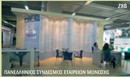
ΠΑΝΕΛΛΗΝΙΟΣ ΣΥΝΔΕΣΜΟΣ ΕΤΑΙΡΕΙΩΝ ΜΟΝΩΣΗΣ