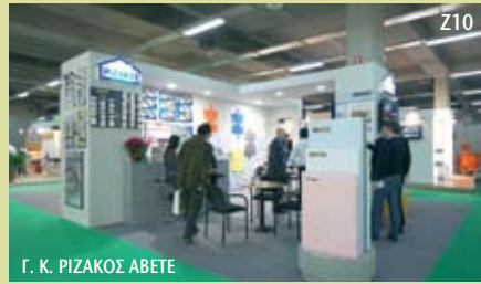
Γ. Κ. ΡΙΖΑΚΟΣ ΑΒΕΤΕ