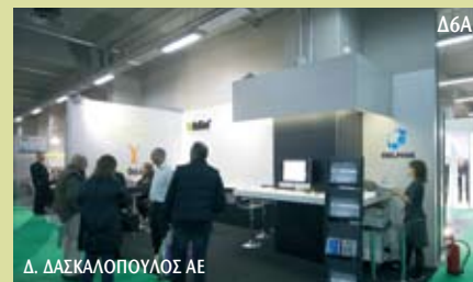
Δ. ΔΑΣΚΑΛΟΠΟΥΛΟΣ ΑΕ