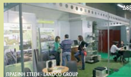
Δ8B ΠΡΑΣΙΝΗ ΣΤΕΓΗ - LANDCO GROUP