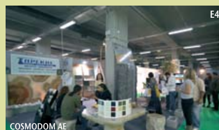
E4 COSMODOM AE