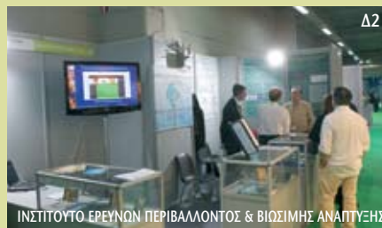
ΙΝΣΤΙΤΟΥΤΟ ΕΡΕΥΝΩΝ ΠΕΡΙΒΑΛΛΟΝΤΟΣ & ΒΙΩΣΙΜΗΣ ΑΝΑΠΤΥΞΗΣ