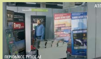
ΠΕΡΙΟΔΙΚΟΣ ΤΥΠΟΣ ΑΕ