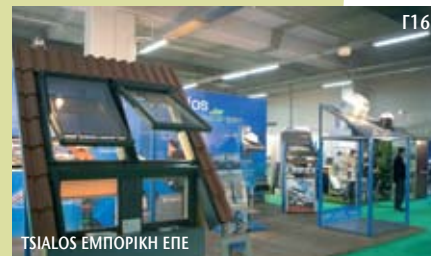
TSIALOS EMPORIKH EPE