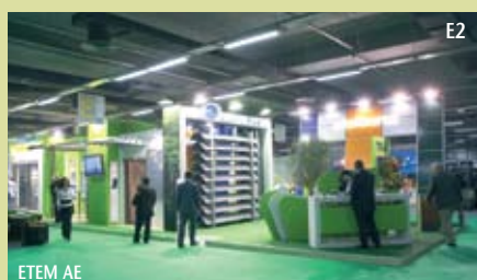
E2 ETEM AE