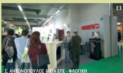
E3 Σ. ΑΝΤΩΝΟΠΟΥΛΟΣ & ΣΙΑ ΕΠΕ - ΦΛΟΓΙΚΗ