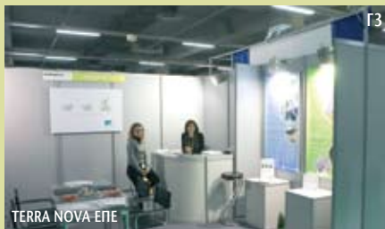
TERRA NOVA EPE