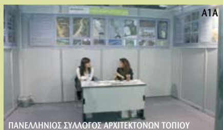
ΠΑΝΕΛΛΗΝΙΟΣ ΣΥΛΛΟΓΟΣ ΑΡΧΙΤΕΚΤΟΝΩΝ ΤΟΠΙΟΥ