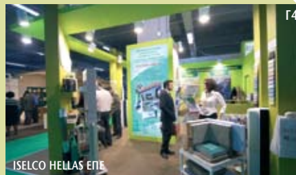
ISELCO HELLAS EPE